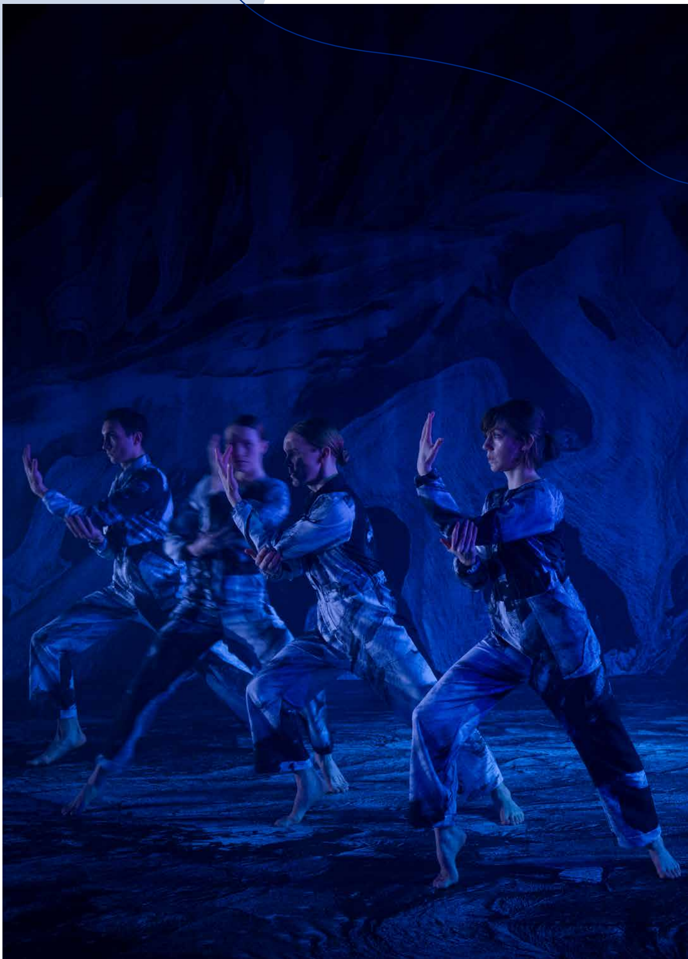
Hvíla sprungur